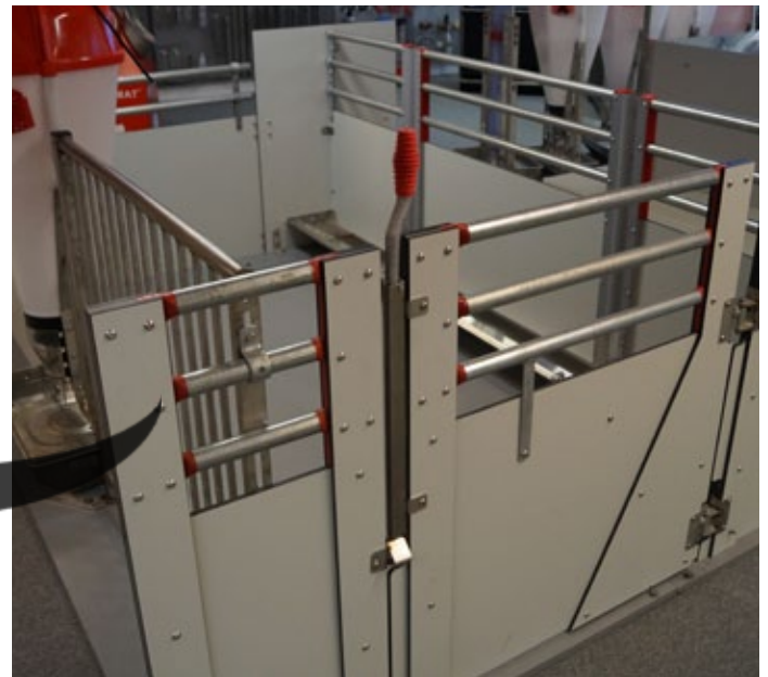
FUNKI FIBER con puerta suspendida estándar